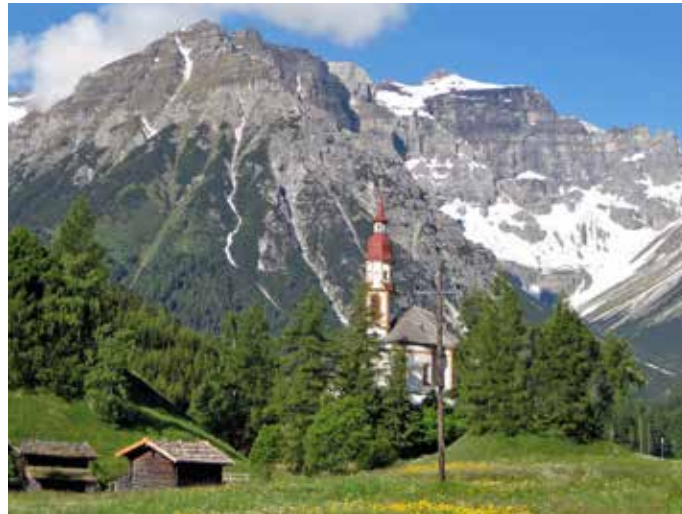
Ein wahres Postkartenmotiv ist die dem hl. St. Nikolaus gewidmete Kirche in Obernberg; im Hintergrund der Obernberger Tribulaun Dedicated to St. Nicholas, the church in Obernberg is a picturesque motif; in the background, the Obernberger Tribulaun.

Geist und unserer Seele.“ Auswirkungen, auf die auch Generalvikar Jakob Bürgler in seiner Predigt einging: „Wandern und Wandeln stehen nicht nur aufgrund des verwandten Wortstammes miteinander in Verbindung.“