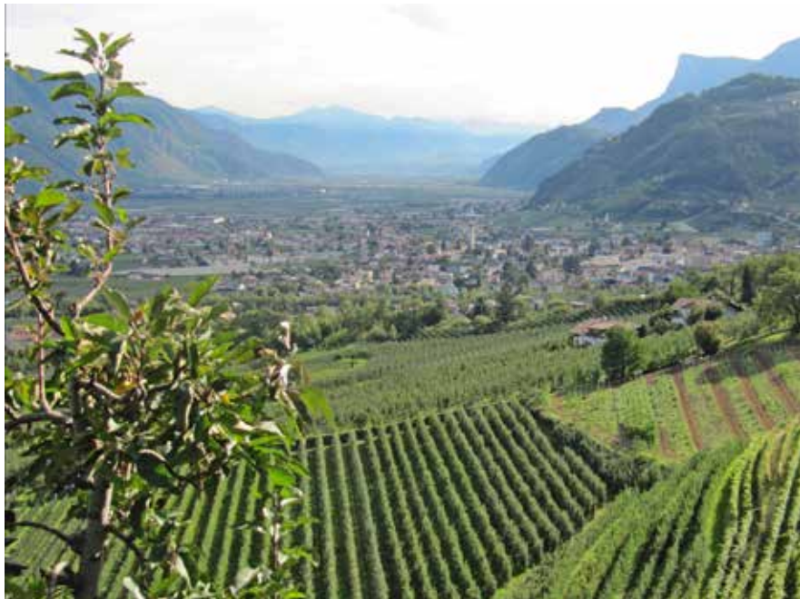
Der Meraner Talkessel ist erreicht: Links das Schloss Auer, rechts die den Marlinger Waalweg säumenden Weinberge mit Lana im Hintergrund. • The Meran basin is reached: left, Schloss Auer, right, the vineyards bordering the Marlinger Waalweg with Lana in the background.

which was published in spring 2015 with a still more precise route description and recommendations as to where to spend the night.