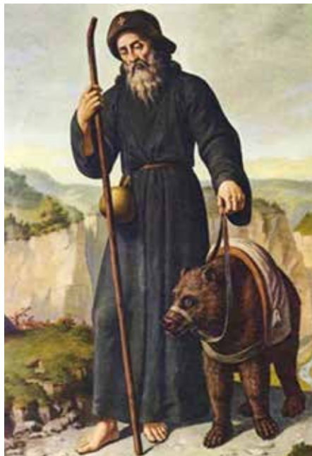
Der Heilige Romedius mit Pilgerstab und Bären

In Thaur hat die Reise am Sankt Romedius Weg begonnen, vom letzten Ort