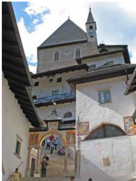
San Romedio, das Ziel des Pilgerweges, besteht aus mehreren Kirchen und Kapellen auf einem 70 m hohen Kalkfelsen.